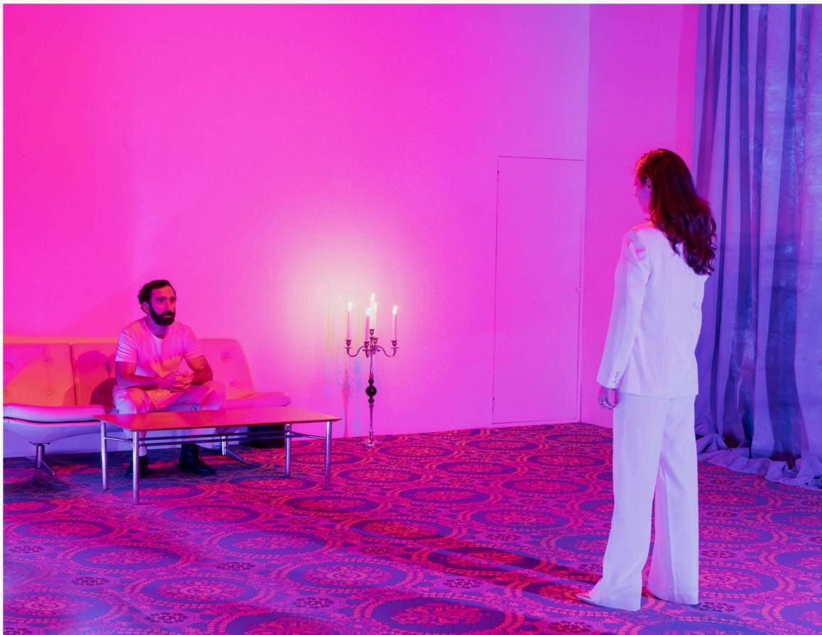
Ce pays qui nous était destiné - © Emmy Martens

Juillet 2025 Festival d'Avignon au "11" du 5 au 24 à 18h35 , 11 Bd Raspail, 84000 Avignon