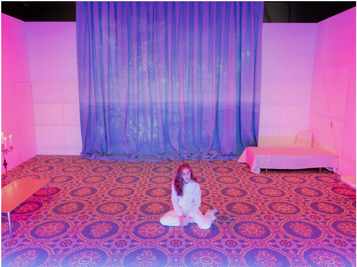
Ce pays qui nous était destiné - © Emmy Martens

Compagnie Salut Martine contact@salutmartine.com | www.salutmartine.com