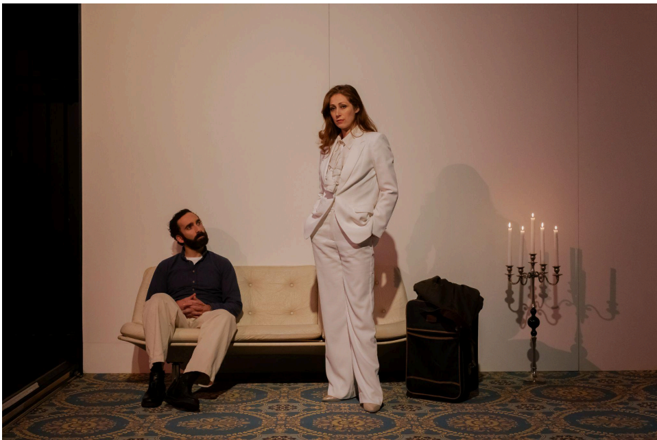
Ce pays qui nous était destiné

Anna a quitté Louis il y a une douzaine d'années pour partir avec un autre homme. Louis n'a jamais pu digérer cette rupture et pour cause : Anna s'est enfuie du jour au lendemain, sans explication. Dix ans plus tard, devenue depuis lors une grande star de cinéma, elle demande à Louis, toujours professeur de philosophie, de la rejoindre sur une île où elle a décidé de terminer ses jours. Condamnée, elle le prie de l'aider à rédiger ses mémoires. Ils ne s'étaient jamais revus. Ce pays qui nous était destiné est l'histoire de leurs retrouvailles.