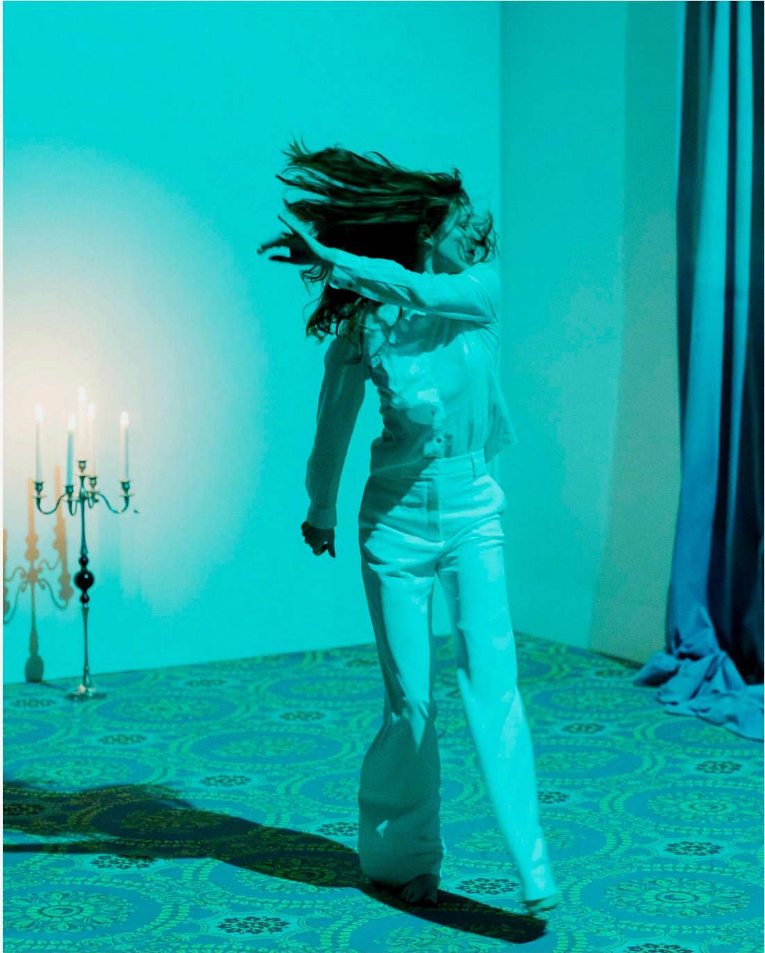
Ce pays qui nous était destiné - © Emmy Martens