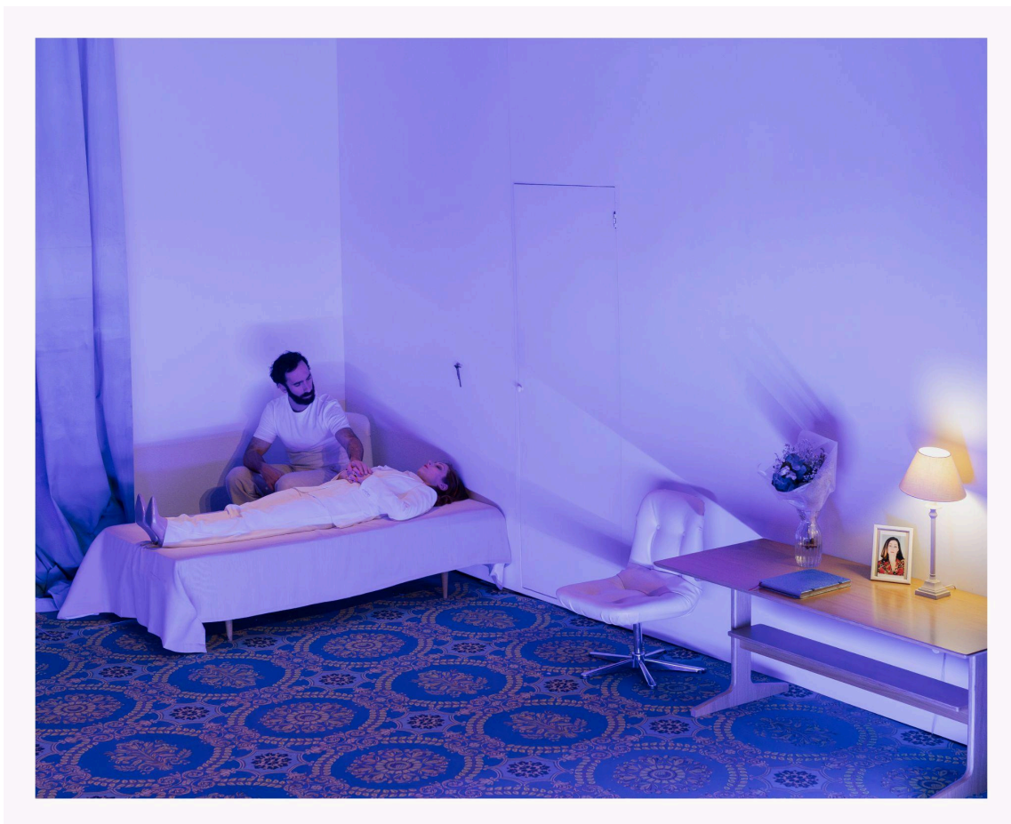
Ce pays qui nous était destiné